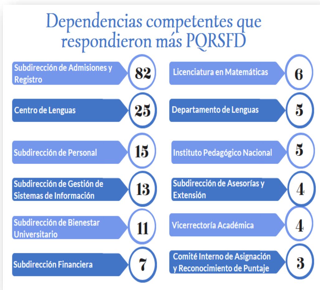
Gráfica No. 5. Dependencias Competentes para dar respuesta a PQRSFD