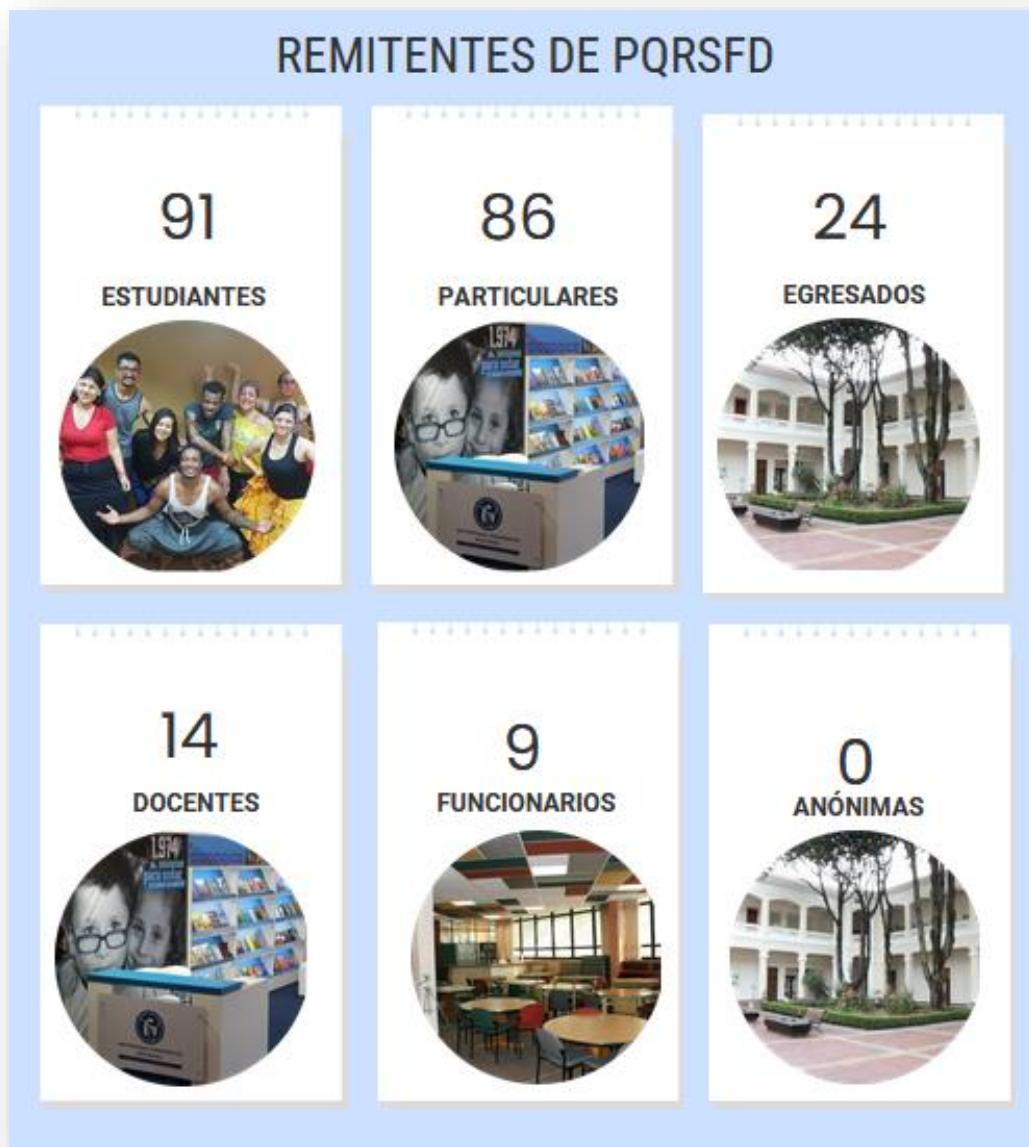
Gráfica No. 3. Remitentes de PQRSFD