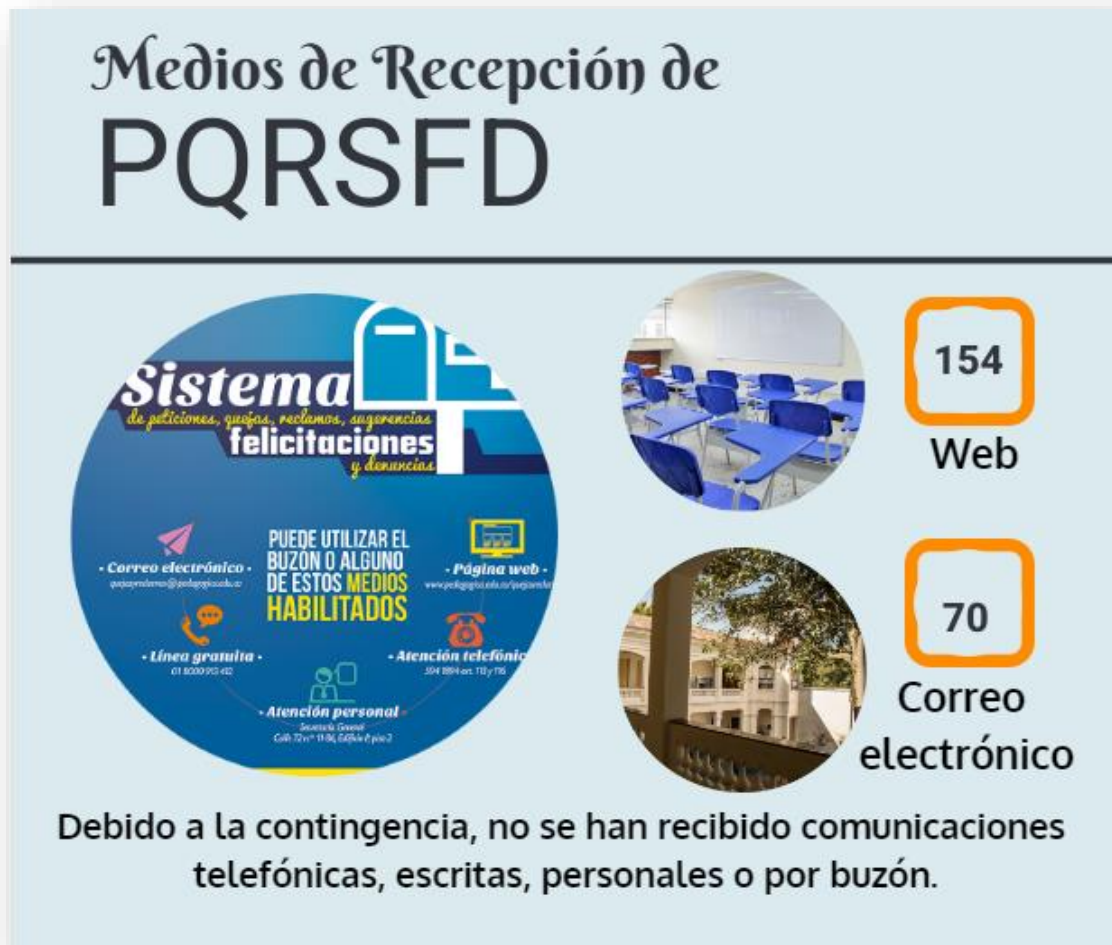
Gráfica No. 2 Medios utilizados para interponer PQRSFD

La Secretaría General de conformidad con el procedimiento PRO003GGU 6 adoptado dentro del Manual de Procesos y Procedimientos de la Universidad en el marco del Sistema de Gestión Integral, recibe, registra en el aplicativo de gestión documental, tramita, analiza y asigna un número de consecutivo en la Tabla de registro, para posteriormente remitir a las dependencias competentes y así efectuar el respectivo seguimiento y control mediante mecanismos que permitan el logro de una pronta y oportuna respuesta.