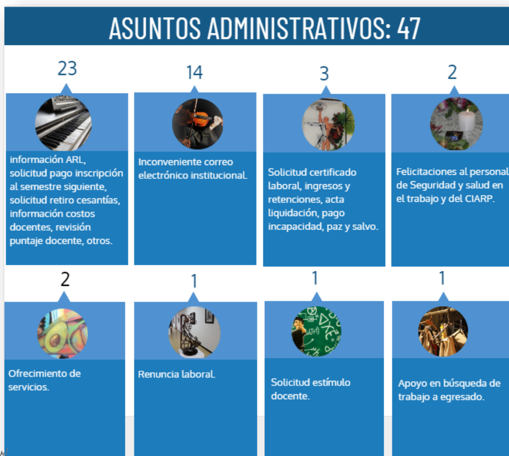
Gráfica No. 4 Motivos para interponer PQRSFD

A continuación, la gráfica No. 4 muestra el consolidado de PQRSFD presentadas durante el IV trimestre de 2020, clasificadas como asuntos administrativos y académicos.