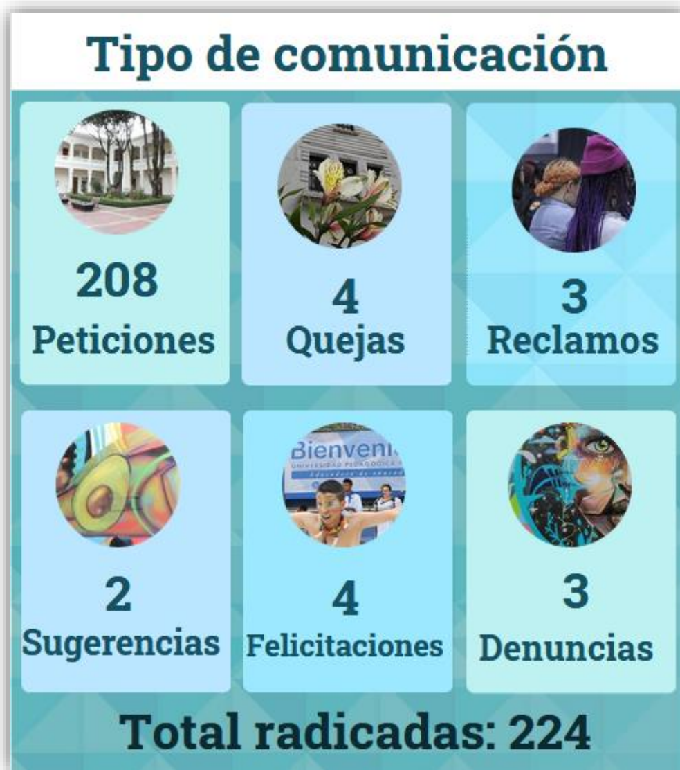
Gráfica No. 1 Comunicaciones recibidas por tipología