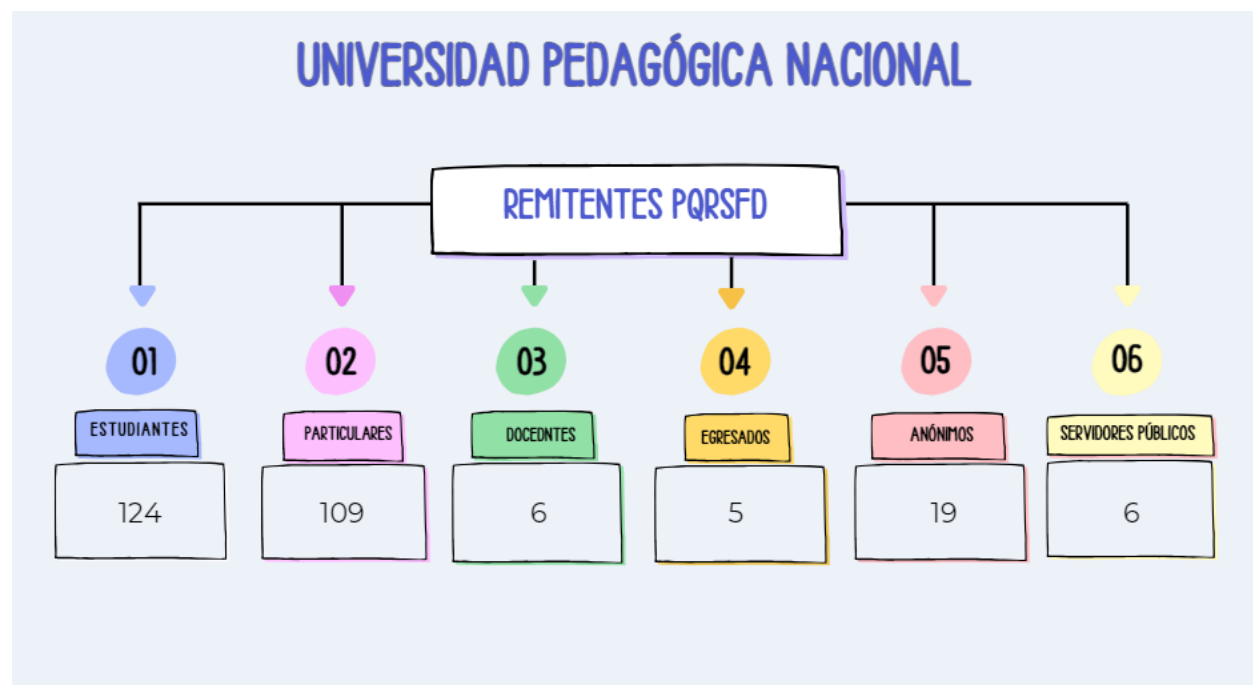
Gráfica No. 3. Remitentes de PQRSFD