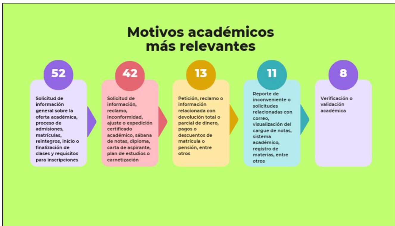
Gráfica No. 4. Motivos académicos para interponer PQRSFD

Fuente: Tabla de Registro Secretaría General